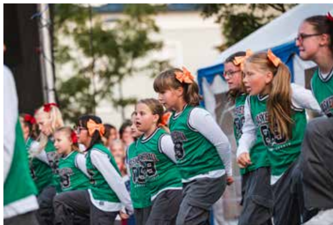
TS Power