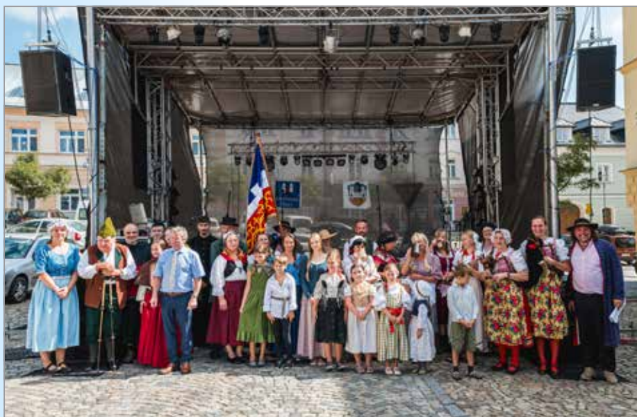
Účastníci průvodu před slavnostním zahájením slavností

■ Slavnosti v Kašperských Horách letos nabídlj jedinečnou atmosféru inspirovanou životem a prací lidí na staré Šumavě.