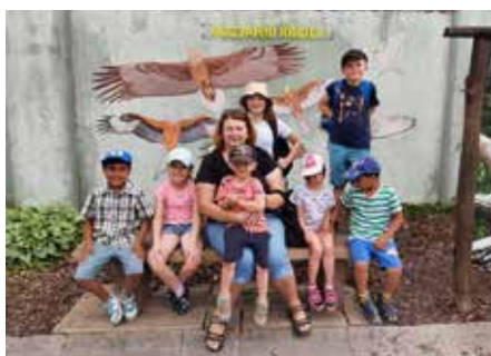
Děti z DD na výletě