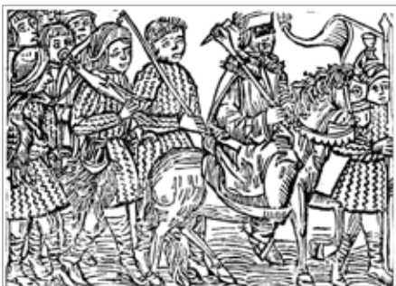
Slepý Jan Žižka v čele vojska

■ Letos 11. října je tomu rovných 600 let od smrti slavného husitského vojevůdce a politika Jana Žižky z Trocnova a Kalicha (cca 1360–1424).