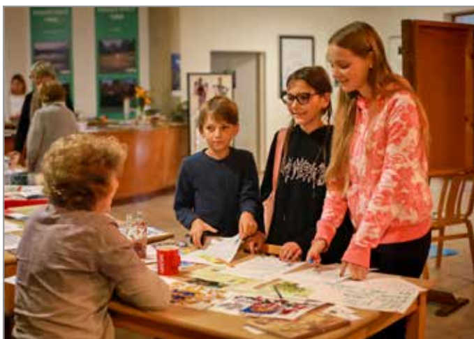
Účastníci Kašperskohorského Babylonu

6. ročník Babylonu – dne jazyků se opět vydařil!