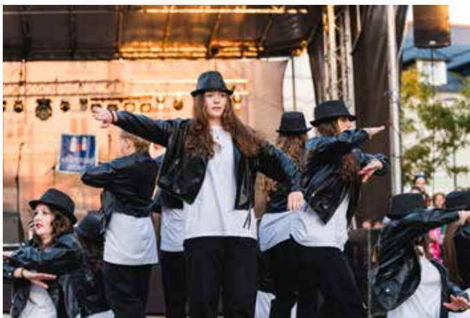
TS Power