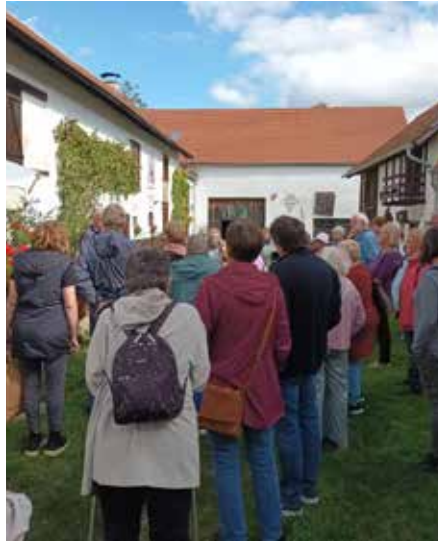
Seniory na výletě

Přesně takové výlety jsou důležité proto, aby seniory měli možnost se jednou za čas vytrhnout z každodenní rutiny. Výlet všem poskytl nejen změnu prostředí, ale také příležitost k sociálnímu kontaktu, což je obzvláště důležité pro ty, kteří jsou osamělí. Po celý den panovala u všech účastníků velmi dobrá nálada.