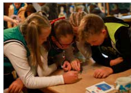
Účastníci Babylonu