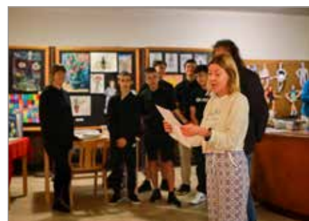
Vyhlášení vítězů