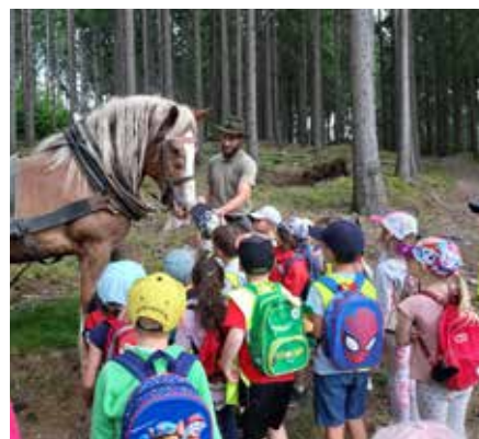
Den lesa