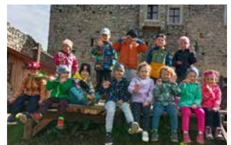
Na hradě Kašperk