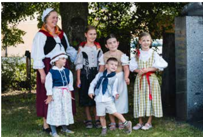
Účastníci průvodu