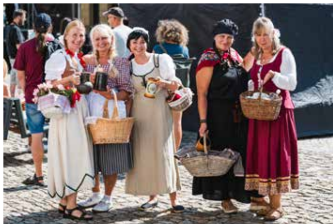
Účastníci průvodu