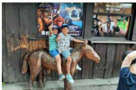
Děti z DD na výletě

Na Lipně děti navštívily Království lesa, svezly se na bobové dráze – to byla jízda! Úžasný byl přejezd přívozem do Frymburka, kde si děti a tety prohlédly město. Další pěkný výlet autem byl do Vyššího Brodu a pěšky po okolí této vodní nádrže, kde se děti také koupaly.