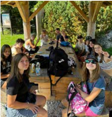
Odpočinek na výletě

Sotva jsme si přinesli druhý den školy tašku plnou učebnic a sešitů, hned jsme studijní materiály vyměnili za stany, spacáky, karimatky a svačinky na cestu. Ráno nás vítal slunečný den na vimperském vlakovém nádraží, odkud jsme vyrazili směr Kubova Huť. Naštěstí jsme si všechny batohy uložili na obci a nemuseli je táhnout do výšin. Výšlap na Boubín stačil opravdu jen s malým batůžkem. Nadšení v prvních kilometrech nepovadalo, nicméně síly před vrcholem trochu docházely. Většinu z nás pod rozhlednou zajímala svačina a výhled byl až