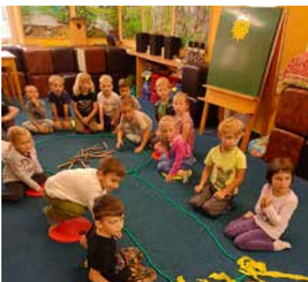
Enviromentální program