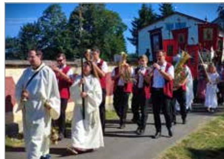
Poutní procesí