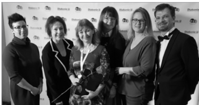
Předávání diplomu - pečovatelka roku