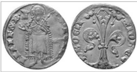
Florén Jana Lucemburského, rub a líc

■ Letos, tedy roku 2025, uplyne rovných 700 let od chvíle, kdy český král Jan Lucemburský zahájil v roce 1325 jako první panovník ve střední Evropě ražbu zlatých mincí zvaných florény. Bylo to v době vrcholícího středověku, kdy se čitelně prosazoval přechod od hospodářství naturálního k hospodářství peněžnímu, v době, kdy cena zlata značně stoupala.