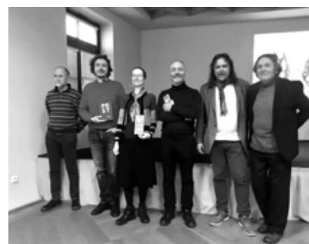
Hosté slavnostního večera

Vladimír Horpeniak Muzeum Šumavy Kašperské Hory