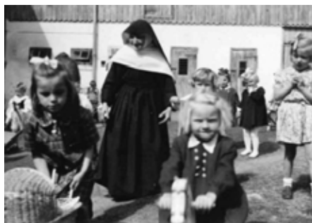
Mateřská škola sester de Notre Dame