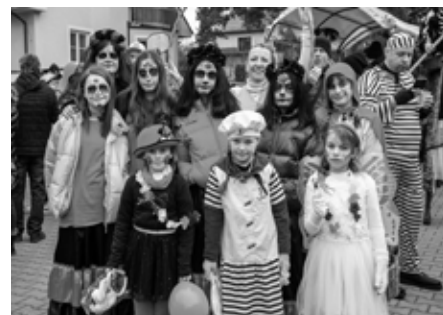
Z masopustu