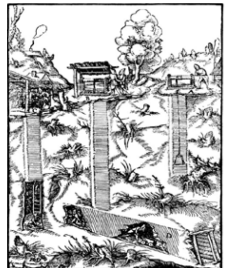
Hlubinné doly, vyobrazení v knize Jiřího Agricoli z roku 1556