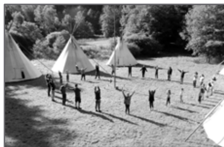
Skautský tábor