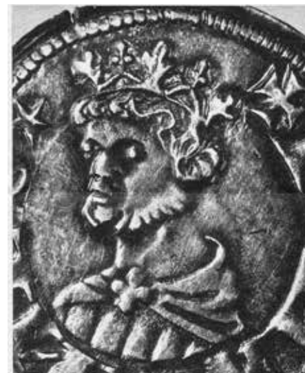
Detail mince s portrétem panovníka