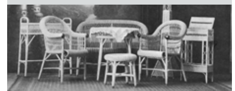
(Proutěný nábytek)