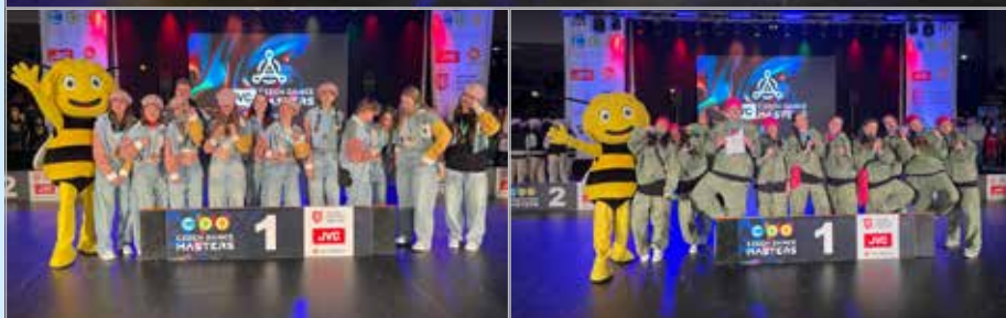
CZECH DANCE MASTERS regionální soutěž v Plzni

■ Naši streetovou taneční skupinu POWER jistě všichni znáte a nemusím vám ji dlouze představovat. Již v několika číslech zpravodaje jste se mohli dočíst o historii a činnosti tohoto tanečního oddílu, který působí v Kašperských Horách 30 let. Pod TJ Kašperské Hory byl začleněn v lednu 2020. Vzhledem k tomu, že je tato sezóna pro nás velmi významná, chceme se s vámi podělit o naše úspěchy postupně. Jako každoročně jsme absolvovali náročnou podzimní část tréninků všech věkových kategorií