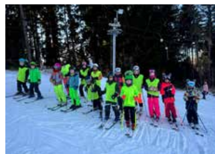
lyžařský oddíl