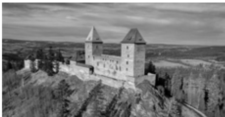
Hrad Kašperk

■ V dubnu se otevírá veřejnosti hrad Kašperk, a s tím začíná i nová návštěvní sezona. Pojďte se společně podívat, co nového chystáme letos během měsíce dubna a května.