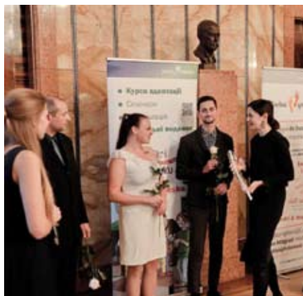
Slavnostní vyhlášení

Nejvíce ale děkujeme za příjemné odpoledne plné smíchu, radosti, sportovních aktivit a báječné zábavy.