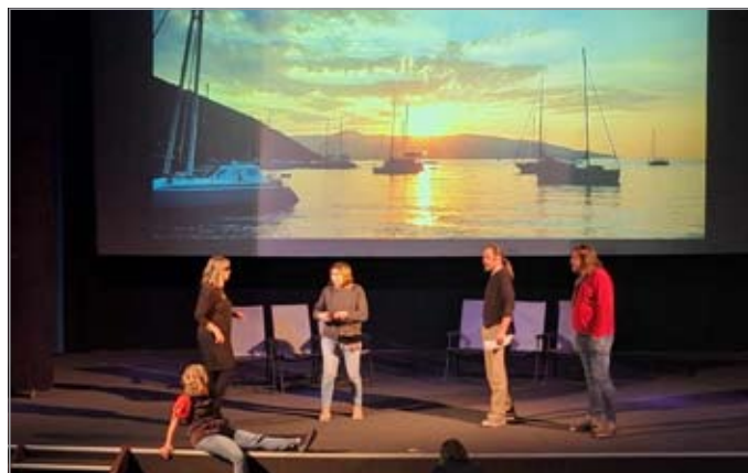
Z divadelní zkoušky

Prodám dvoukolový výsuvný hasičský žebřík za traktor typ: ZD - 1, volat prosím na tel. 721 626 220.