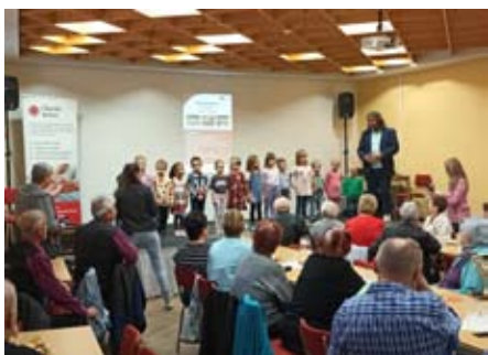
Vystoupení dětí ze školky