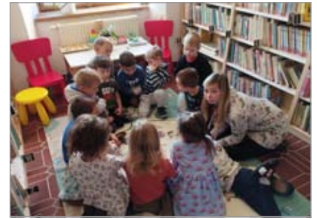
Návštěva knihovny

Pro veřejnost jsme opět připravili svatomartinský průvod se světýlky a jsme rádi, že stále přibývá dětí i dospělých, kteří chtějí tuto tradici s námi prožít a se svatým Martinem a jeho poselstvím tak přivítat přicházející zimu a první sněhové vločky. Do podzimního tématu se děti zapojily i v městské knihovně, kde na ně čekaly soutěže, vyprávění, hry i ukázky pohádek a knih. Nezapomněli jsme ani na kulturní vyžití a děti ze třídy „Včelky“ a „Sluníčko“