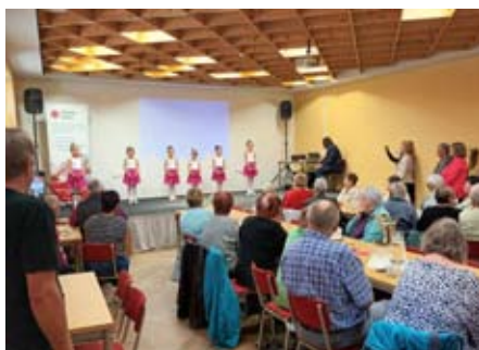
Vystoupení malých baletek