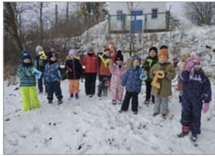
Zamykání lesa

Tak jako každý rok, tak i letos se sešli ve školce rodiče se svými dětmi na podzimním tvoření. Společně si tak vyrobili podzimní a halloweenské dekorace. Rodiče a děti ze „Včelek“ se po těchto odpoledních dílničkách odebrali na zahradu školky, kde si opékali, a děti zpěvem ukolébavky a za světla z lampionků uspávaly broučky. Stále navštěvujeme sportovní halu, kde pod vedením trenéra děti ze „Včelek“ a „Sluníčka“