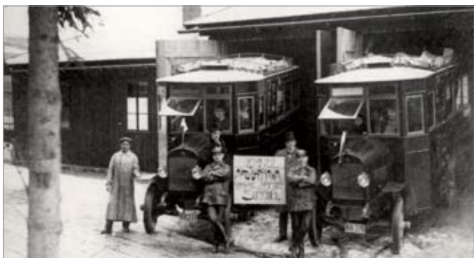
První autobusy Laurin – Klement na lince Vimperk – Kašperské Hory 27.10.1922.

■ Před sto lety, dne 11. října 1924, byl zahájen provoz pravidelné autobusové linky Sušice – Kašperské Hory a zpět. Stalo se