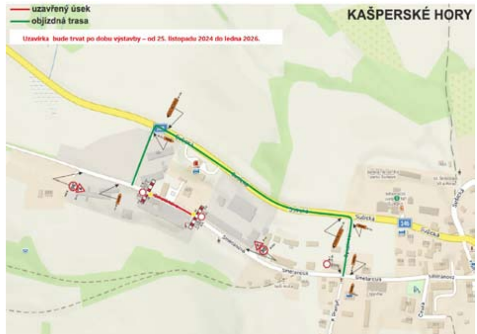
Uzavírka v ulici Smetanova s vyznačenou objízdnou trasou

Provozní doba kanceláře zůstává nezměněna: pondělí, středa, pátek od 07:30 do 15:00. Stejně tak zůstávají beze změny kontakty: e-mailová adresa: sekretariat@evk-kh.cz a číslo telefonu 373 705 108.