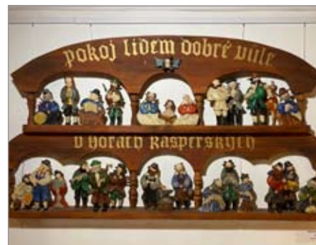
Závěsný betlém Kašperskohorský, Michal Tesař