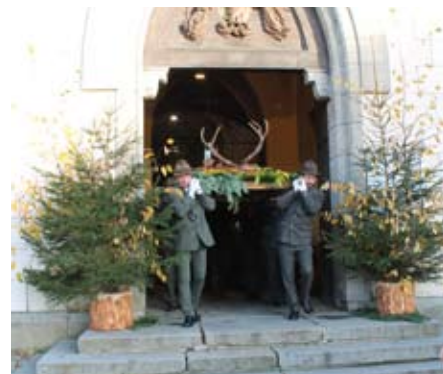
Hubertská mše