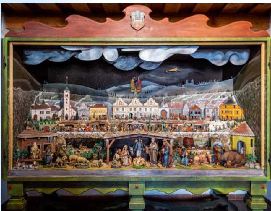
Kašperskohorský skříňový betlém, který se nachází v přízemí radnice

Šumavské betlémy a podmalby na skle - výstava pro adventní a vánoční čas