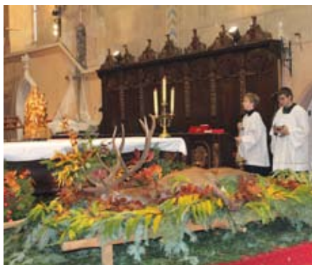
Hubertská mše

Jana Kanalošová Kašperskohorské městské lesy s.r.o.