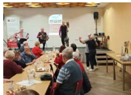
Vystoupení Kůrovců