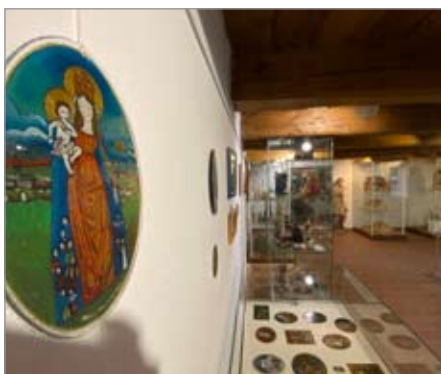
Podmalby na skle s duchovní tematikou jsou součástí výstavy